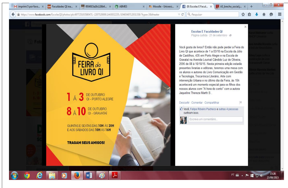
Divulgação da primeira Feira do Livro QI no Facebook das Escolas e Faculdades QI

A primeira Feira do Livro da Faculdade QI foi organizada pelos NADD sendo desenvolvida nos dias 8, 9 e 10 de outubro de 2015. Durante o evento os alunos participaram de exposição de livros, um troca-troca literário, sarau literário e horas do conto.