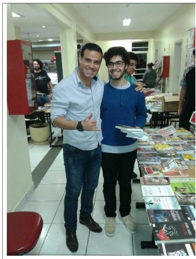
Hora do conto do livreiro para sua neta na Feira do Livro