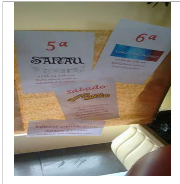
Ornamentação da feira do livro estimulando o troca-troca literário: