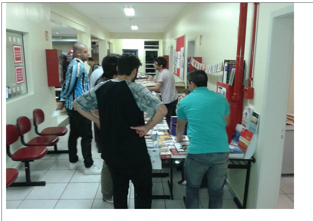
Comunidade conhecendo o troca-troca literário na feira do livro