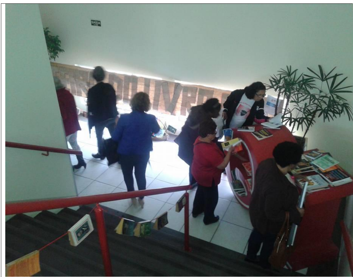
Alunas interagindo o troca-troca literário na feira do livro